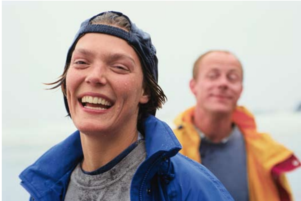
Nur wer vorsorgt, hat im Alter gut lachen. RKM-Mitarbeiter können jetzt über ein firmeneigenes Versorgungswerk sparen, um die Rente später aufzubessern.