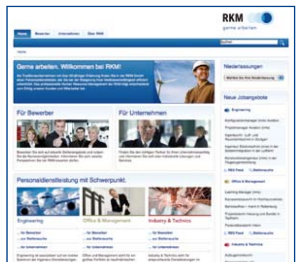
Luftig und übersichtlich – die neue RKM-Homepage.

den Weg durch die drei RKM-Kernbereiche Engineering (blau), Office & Management (olivgrün) und Industry & Technics (magenta). Eine ausführliche Datenbank mit Stellenangeboten sowie ein umfangreicher Downloadbereich und viele Informationen über sämtliche Dienstleistungen von RKM machen die Homepage sicher schnell zu einem unverzichtbaren „Favoriten“ bei Bewerbern und Unternehmen.