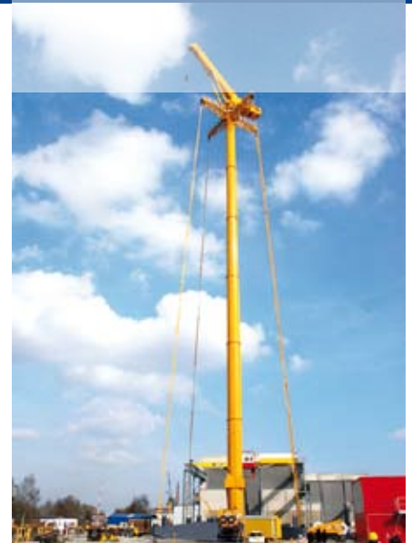
Wettbewerbsvorteile durch modernste Hubtechnik.

Das Kerngeschäft von Grove bildet die Produktion so genannter All Terrain-Krane (AT-Krane). Die Produktpalette umfasst vom zwei- bis zum siebenachsigen Mobilkran mit einer Hubkraft von 35 bis 450 Tonnen derzeit 15 Produkte. Die AT-Krane von Grove kombinieren die Fahrgeschwindigkeit von LKW-Aufbaukranen mit herausragender Manövrierbarkeit im Gelände. Das wird durch das einzigartige MEGATRAK™-Aufhängungssystem ermöglicht.