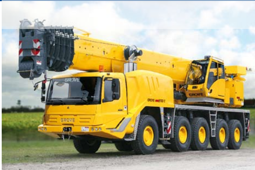
Kraftpaket – ein Grove LKW-Kran unterwegs.

Die Innovationsfähigkeit von Grove Mobilkranen ist ungebremst. So wurden alleine in den letzten zwei Jahren im Vier- und Fünffachser-Segment sechs neue Modelle vorgestellt. Diese Fahrzeuge werden mit einer neuen Unterwagen-Kabine ausgestattet, die in Sachen Aerodynamik, Ergonomie und Sicherheit Maßstäbe setzt. Dem Kunden bietet diese Neuerung besondere Vorteile: Geringerer Kraftstoffverbrauch, gesteigerter Fahr- und Bedienkomfort und höhere Traglasten.