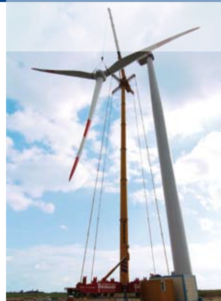
Zwei Riesen ragen in den Himmel – ein Manitowoc-Kran im Einsatz bei der Montage eines Windrades.